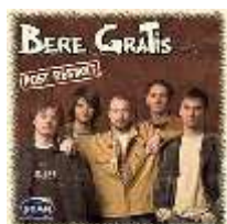
Post Restant (LP, 2005)