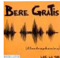
Electroponica (LP live, 2004)