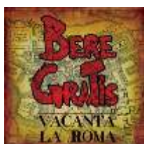
Vacanță la Roma (Single, 2009)