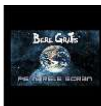
Pe marele ecran (LP, 2009)