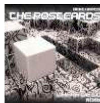
Where We Go/Rosy (EP, 2007, Elveția)