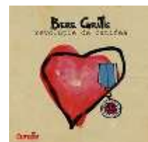
Revoluție de catifea (LP, 2007)