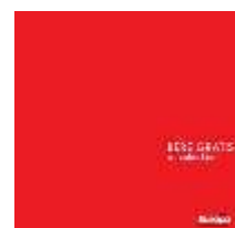
O colecție (LP, 2010)