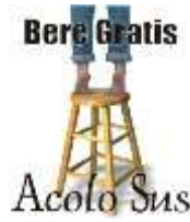
Acolo sus (LP, 2003)