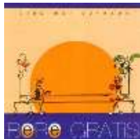
Vino mai aproape (LP, 2001)