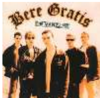
De vânzare (LP, 2000)